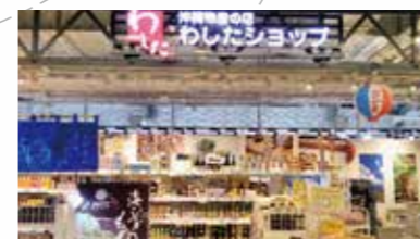
わしたショップリンクスウメダ店