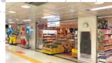
札幌わしたショップ