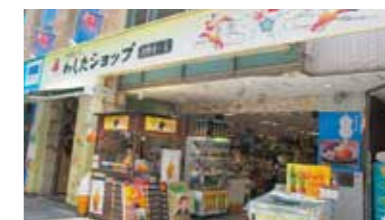
わしたショップ国際通り店