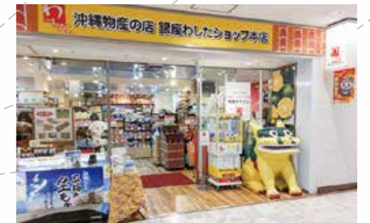
銀座わしたショップ本店