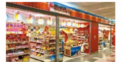
名古屋わしたショップ