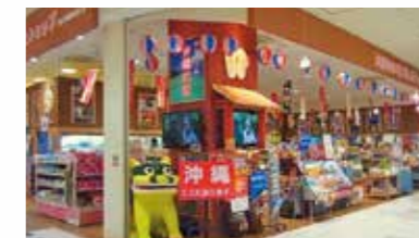
わしたショップイオンレイクタウン kaze