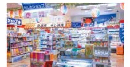
那覇空港わしたショップ