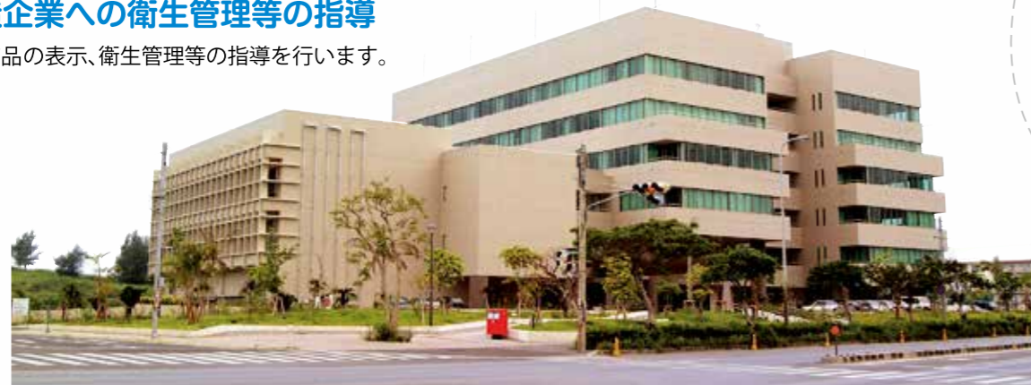
沖縄産業支援センター7階